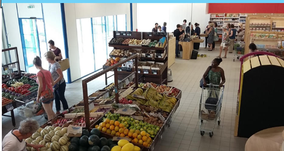
Le 22 août 2017, pour son ouverture, le magasin Biocoop de Saint-Marcel a enregistré une belle affluence

Il offre, en plus, un espace de jeux pour les enfants et un accueil pour les sociétaires de la coopérative Nymphéa. Des animations culinaires, des fabrications « maison » et des présentations de produits bio y sont régulièrement organisées.