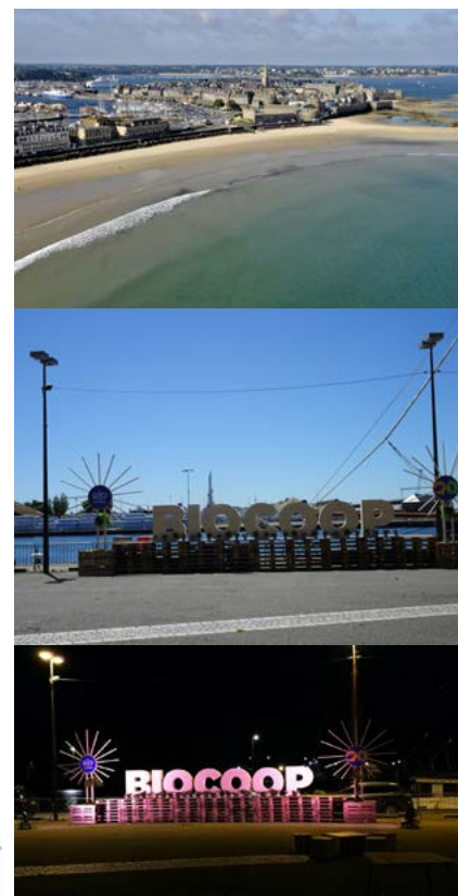
Le Palais des Congrès de Saint Malo (35400) avec vue sur Petit & Grand Bé